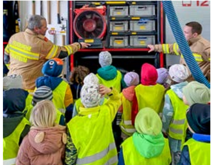
Exkursion zur Freiwilligen Feuerwehr