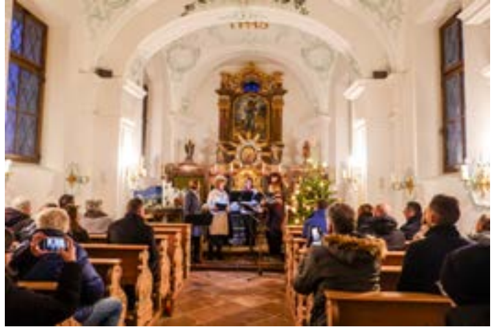
Besinnlicher Nachmittag in der Gut-Hirten-Kapelle