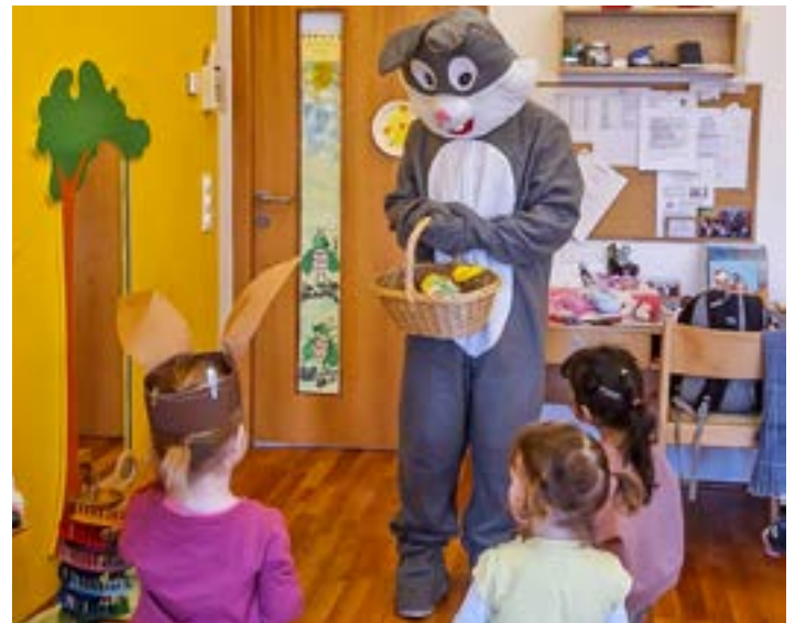
Der „JVP-Osterhase“ überraschte unsere Kinder mit seinem Besuch.