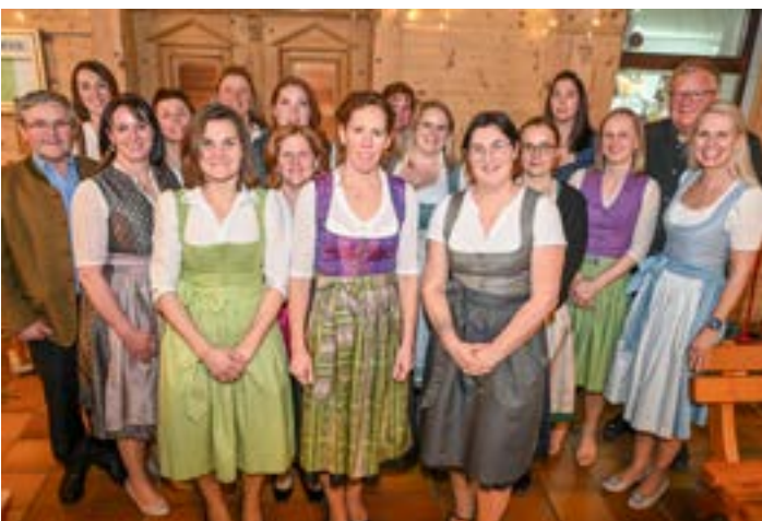
Der neue Bäuerinnen Ausschuss mit den Ehrengästen