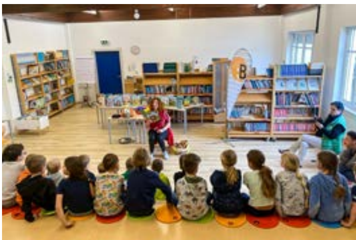
Volle Konzentration beim Lese-Workshop in der Volksschule