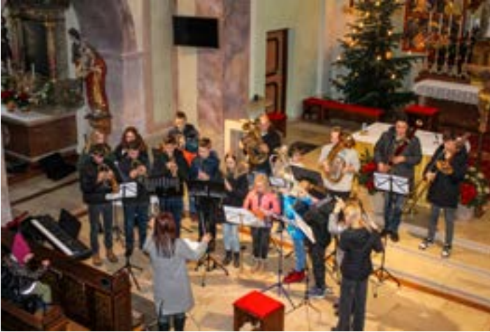
Besinnlicher Nachmittag in der Pfarrkirche

wandern und sich das Friedenslicht abzuholen, welches von der Feuerwehrjugend nach Obertrum geholt wurde. Gesammelt wurde bei diesem „Besinnlichen Nachmittag“ auch für in Not geratene Familien und für akute Notfälle. ■