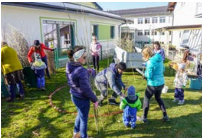
Projekt Weidenhaus in Zusammenarbeit mit dem Elternbeirat und dem Verein Menschenwerk